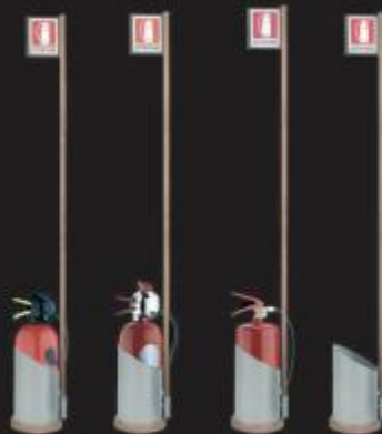
PIANTANA SENZA ASTA ART. 585 COD. URANIO

Si fa sempre trovare. Per grandi ambienti dove è fondamentale farsi notare.