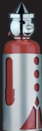
PINOKKIO 2 Kg ESTINTORE A POLVERE 13A -MBC OMOLOGATO UNI EN 3-7 ART. 3495 COD. PNK2/998

Estintore completo di camicia in acciaio lavorata a laser. Finitura con vernice poliestere.